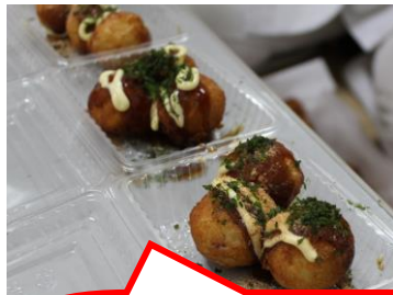
栄養課で作られたあげたこ焼き