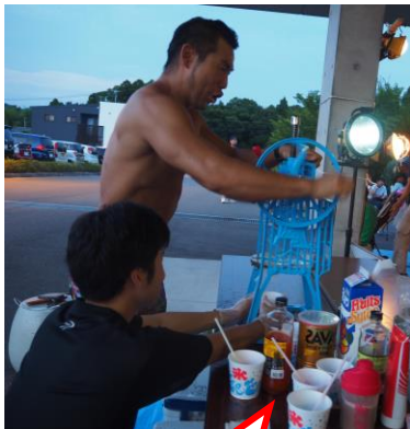
筋肉かき氷 マッスル！ マッスル！！