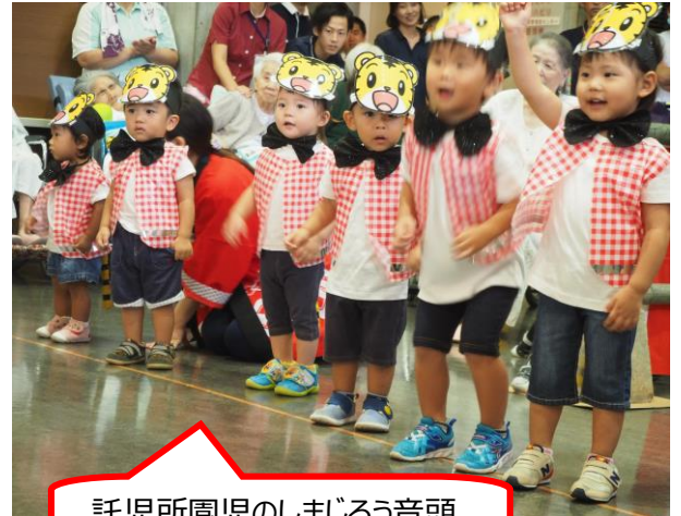
託児所園児のしまじろう音頭