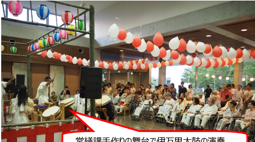
営繕課手作りの舞台上で伊万里太鼓の演奏

8月19日、今年第10回の節目となる夏祭りの開催となりました。今回のテーマは“笑顔満祭”ということで、病棟入院患者さんとその家族の方々に笑顔と元気を与える事を目的とする回にしたいと考えて計画しました。営繕課で作成した会場は紅白で飾られ節目にふさわしい夏祭りのステージが出来ました。当院の託児所の園児たちによるダンス“しまじろう音頭”を可愛らしく踊ってくれ、また伊万里太鼓の演奏と大いに盛り上がりました。ゲームコーナーでは射的、お手玉ダーツ、ボーリングと回って得点を重ねて景品をもらうのですが、時折歓声があがり賑やかで楽しんで頂けました。今年も本格的な博多ラーメンや筋肉かき氷、栄養課で作られたたこ焼き、芋かりんとう、フライドポテトも好評で皆さん美味しそうに食べていらっしゃいました。